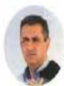
Γιώργος Κουσιόδης Περιφερειάρχης Δυτικής Μακεδονίας